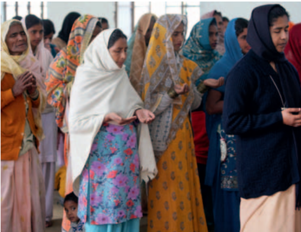
Sonntagsmesse in der katholischen Kirche St. Francis in Suwar