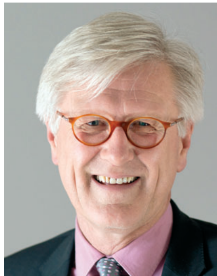
Reinhard Kardinal Marx Vorsitzender der Deutschen Bischofskonferenz