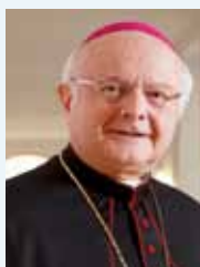
Erzbischof Dr. Robert Zollitsch Vorsitzender der Deutschen Bischofskonferenz