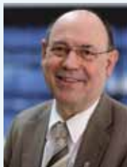
Dr. h.c. Nikolaus Schneider Vorsitzender des Rates der Evangelischen Kirche in Deutschland

Wir wünschen Ihnen Gesundheit an Leib und Seele und Gottes Segen für Ihre Wettkämpfe!